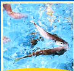
魚のつかみどり 小学生対象