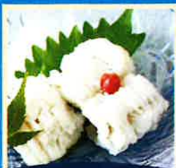
魚の湯引き無料配布